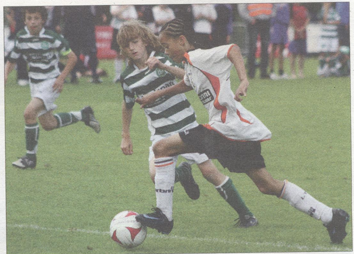
156 Mannschaften treten heuer beim Cordial Cup an und werden wieder für spannende Partien sorgen.

Going rüstet sich für Bayern München Legende Roy Makaay und seine U13 Mannschaft von Feyenoord Rotterdam.