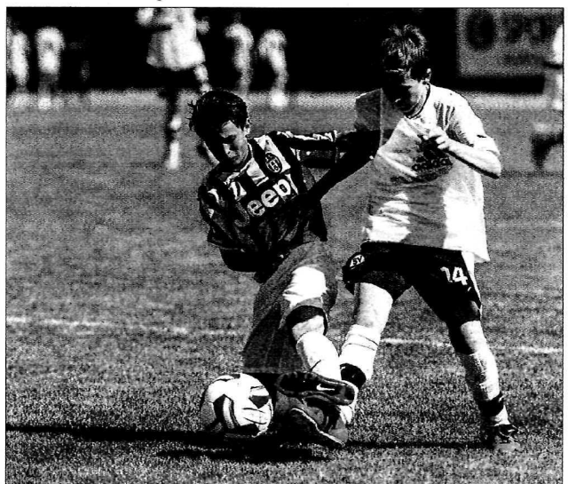
Es wurde um jeden Ball erbittert gekämpft.