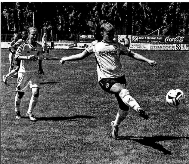
Tollen Fußball zeigten auch die Mädchenmannschaften.