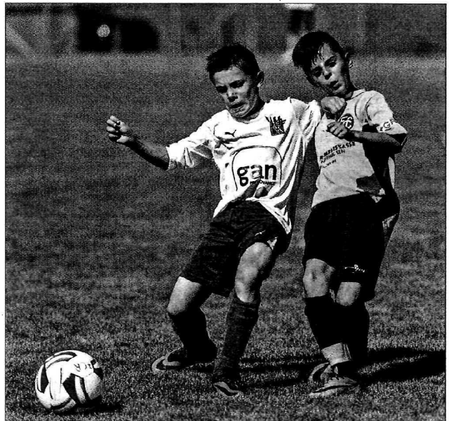
Neue Freundschaften wurden am Rasen nicht geschlossen.