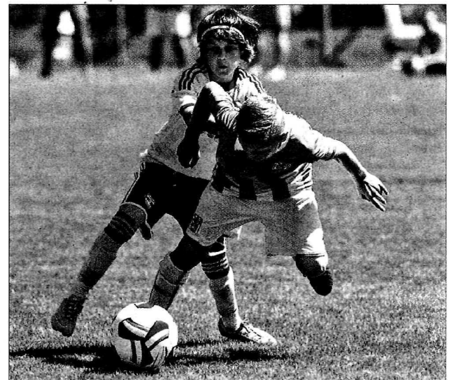
Einsatz total zeigten die U11-Burschen aus Salzburg.