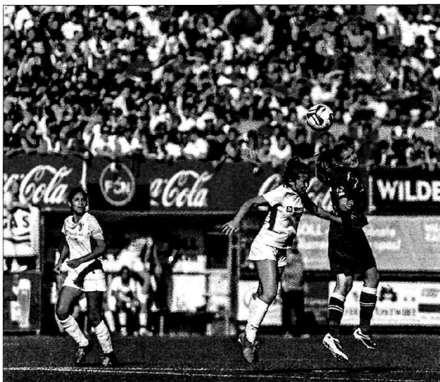
Das Finale der Mädchen entschied das US-Team für sich.