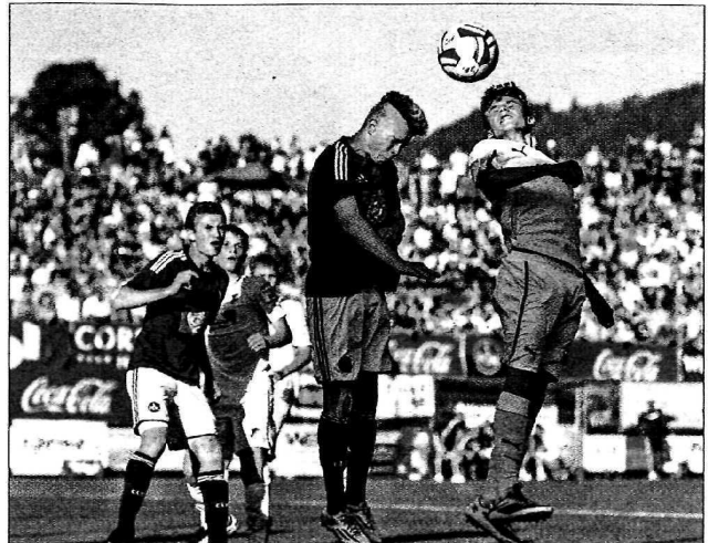
5.000 Zuschauer verfolgten die Finalspiele in Söll.