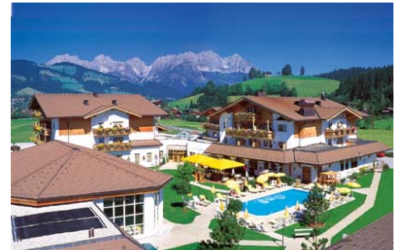
CORDIAL Golf & Wellness Hotel Reith