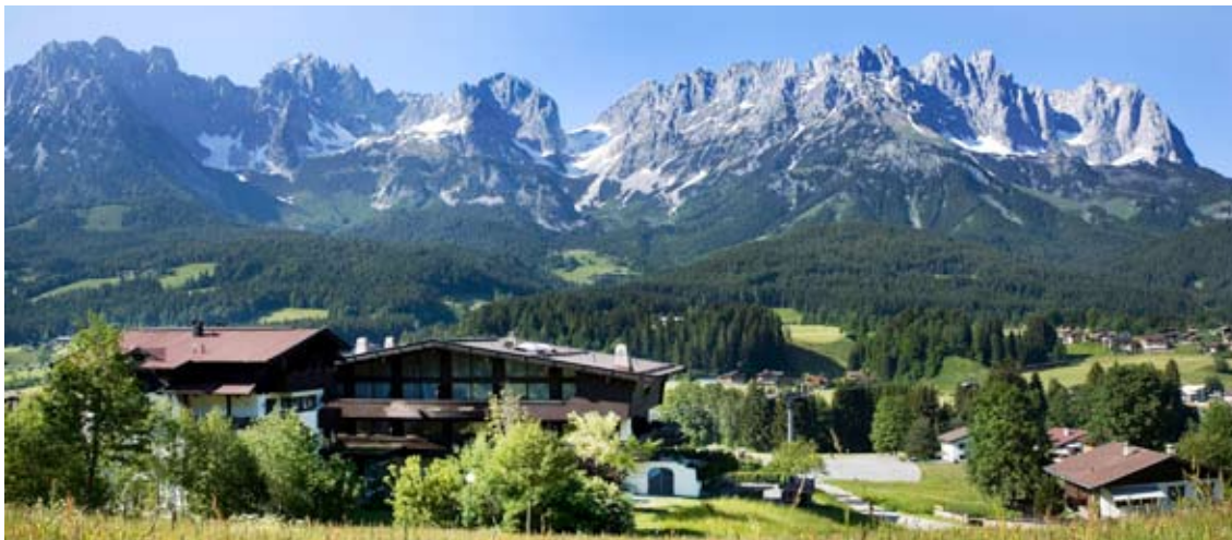
CORDIAL Familien & Sport Hotel Going

Alle Buchungsanfragen sind über HG Sportpromotion abzuwickeln!