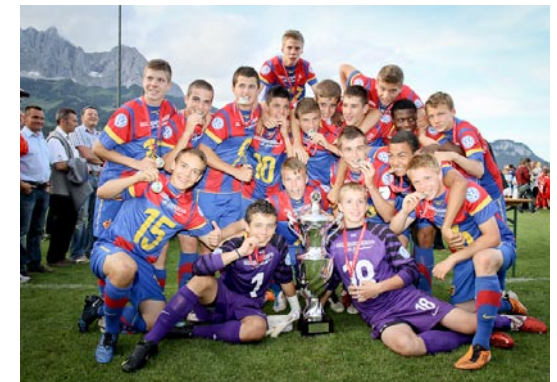
FC Basel, Sieger U15