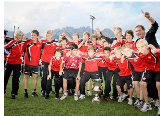
1. FC Nürnberg, Sieger U13