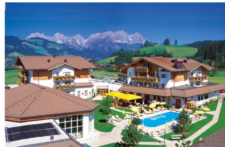
CORDIAL Golf & Wellness Hotel Reith