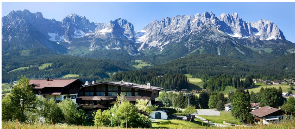
CORDIAL Familien & Sport Hotel Going

Alle Buchungsanfragen sind über HG Sportpromotion abzuwickeln!