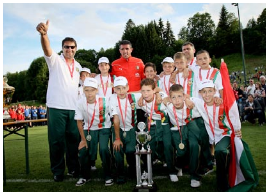
Fonix-Gold Fc. Fehérvár, Sieger U11